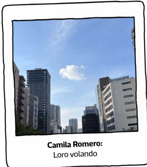
Camila Romero: Loro volando